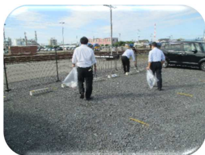
(小名浜駅周辺のゴミ拾い)

弊社は、毎月月初めに福島臨海鉄道沿線及び小名浜駅構内周辺のゴミ拾いを実施しています。これからも地域住民の皆様にも愛される鉄道をめざしてまいります。