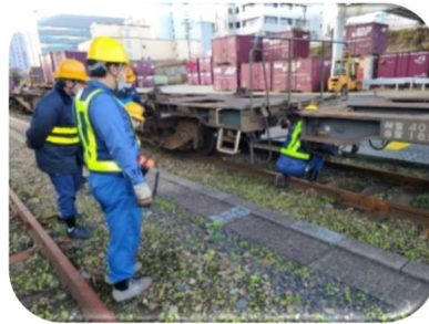
(3線連結の基本動作)