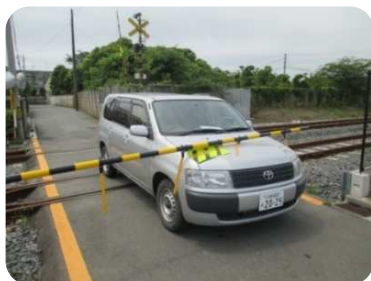
※写真①(車で押し上げて脱出している所)