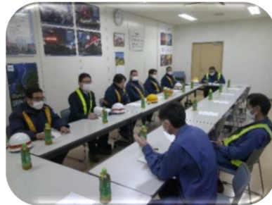
(他山の石による討論)