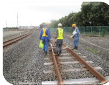
(本線上の軌道検測②)