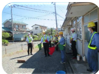
(手旗による手信号の取扱)