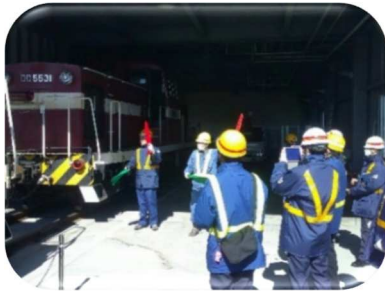
(手旗による連結合図)