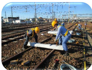
（泉駅構内の取替：58 本）