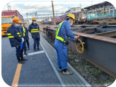
(手ブレーキ、反射テープの扱い方)

日立駅では、日本貨物鉄道(株)土浦駅様指導の下、毎月1回事故防止訓練会を開催し事故撲滅に努めてまいりました。「安全は、鉄道事業の存立基盤であり、人命を守ること」という安全の理念と定義を全社員で共有し、これからも正しい作業を実行することが「安全最優先」の行動そのものと考えます。