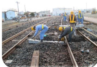
（小名浜駅構内の取替：48 本）