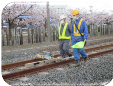
(本線上の軌道検測①)