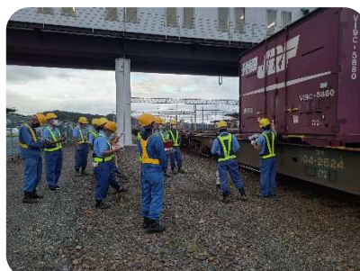
(コンテナ積付検査の教育訓練)